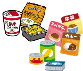
レトルト食品・缶詰・お菓子など

「まだ食べられる」のに規格外や余剰品として処分される食品や、ご寄附いただいた食品を、必要とする方々に届ける活動です。