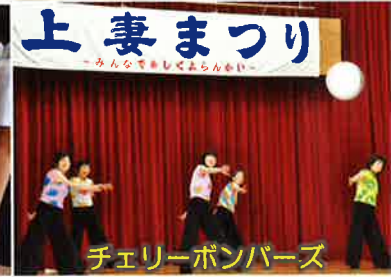
チェリーボンパース