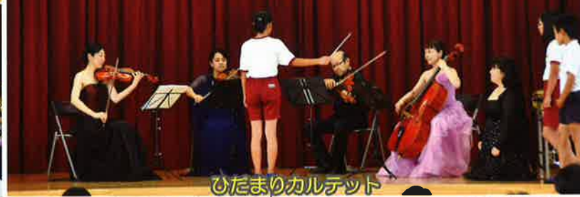
ひだまりカルテット