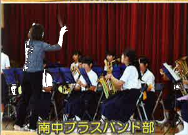
南中プラスバンド部