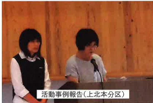
活動事例報告(上北本分区)