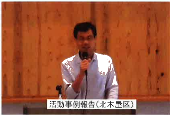
活動事例報告(北木屋区)

発行●社会福祉法人八女市社会福祉協議会(八女市社会福祉会館内) 〒834-0031 八女市本町599番地