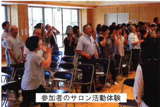
参加者のサロン活動体験