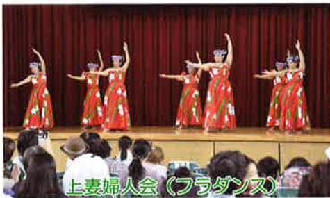
上妻婦人会(フラダンス)

発行●社会福祉法人八女市社会福祉協議会(八女市社会福祉会館内) 〒834-0031 八女市本町599番地