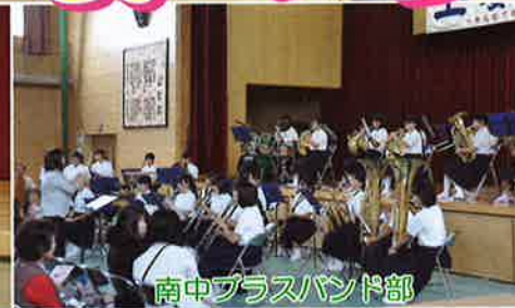
南中ブラスバンド部