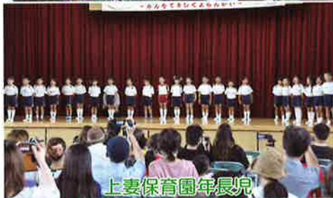
上妻保育園年長児