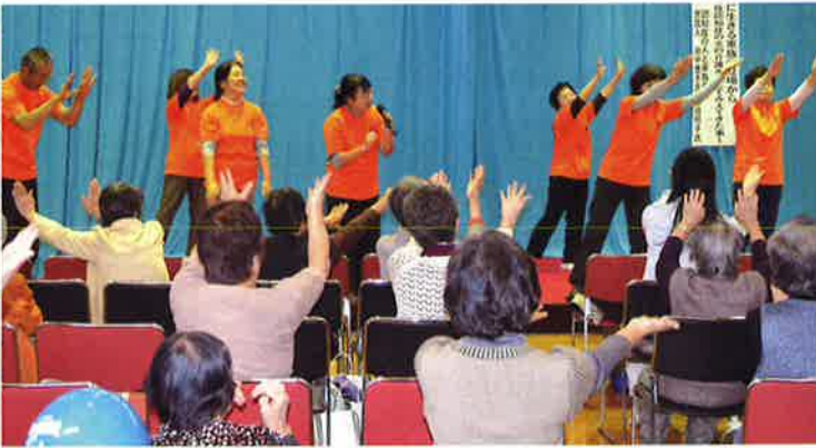
杣の会による健康体操