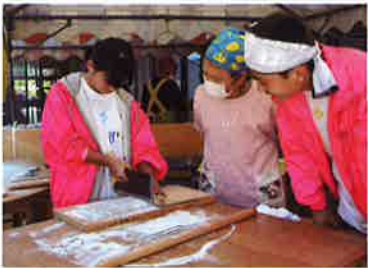
蕎麦打ち体験 (母子寡婦福祉会)