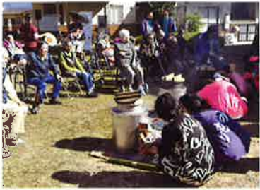
うまい飯釜戸炊き体験

発行●社会福祉法人八女市社会福祉協議会(八女市社会福祉会館内) 〒834-0031 八女市本町599番地