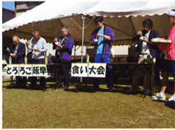
とろろご飯早食い大会