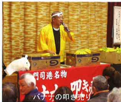
バナナの叩き売り