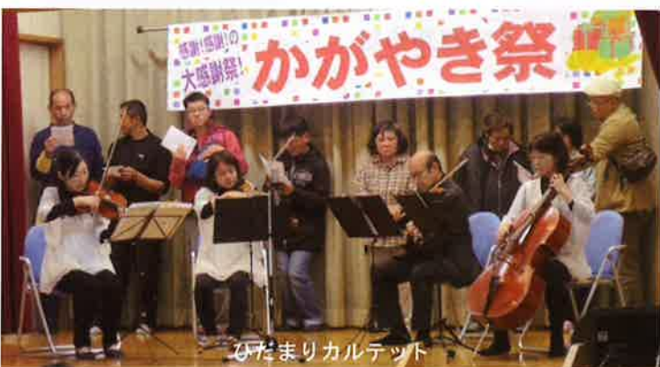
ひだまりカルテット