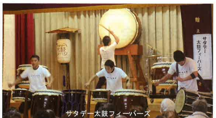
サタデー太鼓フィーバース