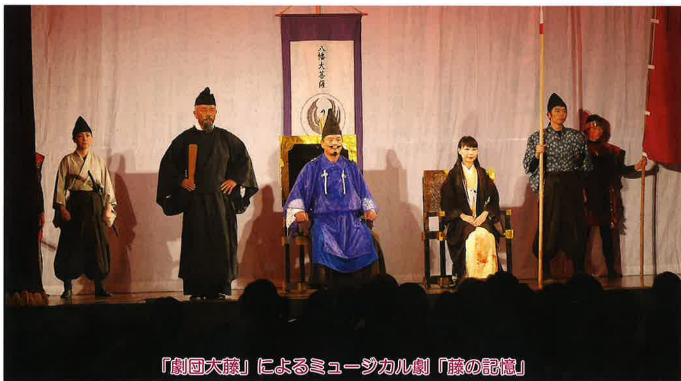
「劇団大藤」によるミュージカル劇「藤の記憶」