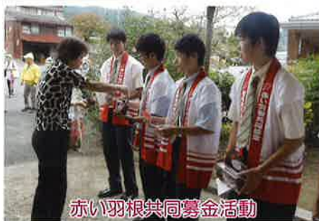
赤い羽根共同募金活動