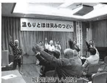
娯楽演芸八ん茶連