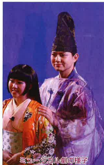
ミュージカル劇の様子