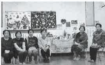
いきいきサロン さくら会

現在、八女市では、147カ所の地域でサロンが開催されています。「ふれあいいきいきサロン」活動は、在宅高齢者の閉じこもりや寝たきりの防止、仲間づくりなどを目的として、地域の住民である高齢者とボランティアと一緒に交流の場づくりをすすめる活動です。最近では、参加者の健康づくりを目的とした健康体操や運動に取り組むサロンも増え、介護予防の効果も期待されています。