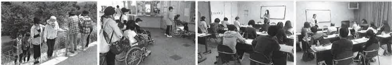
平成28年度八女市社協主催講座の様子「同行援護従業者養成・ガイドヘルパー養成・介護職員初任者研修」

市内在住または市内の事業所にお勤めの方で、介護職員初任者研修修了者、介護支援専門員、看護職員などの有資格者や、介護に関心があり、今後、認知症サポーターや介護予防サポーターの講習を受けてみたい方や介護の資格取得を検討されている方など。