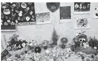
サロン参加者の作品

2月下旬より各校区において「ふれあいいきいきサロン連絡会」を開催いたします。日程、ふれあいいきいきサロンの助成金等の詳細につきましては、八女市社会福祉協議会本所、各支所までお問い合わせ下さい。