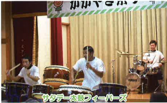
サタデー太鼓フィーバース

発行●社会福祉法人八女市社会福祉協議会(八女市社会福祉会館内) 〒834-0031 八女市本町599番地