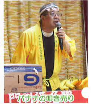
バナナの叩き売り