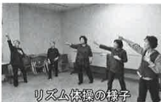
リズム体操の様子

平成24年5月に発足し、「八女市のサロンを盛り上げたい、要望や問題等を解決したい、サロン活動を支援したい」と熱い気持ちを持った仲間が集まっています。