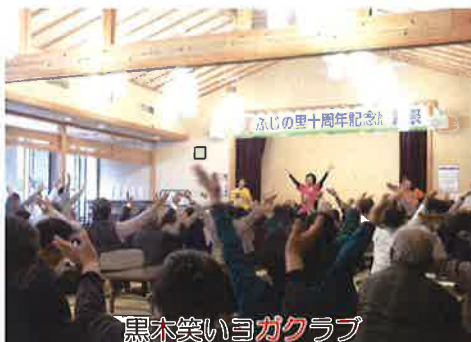
黒木笑いヨガクラブ