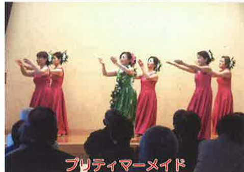
プリティマーメイド