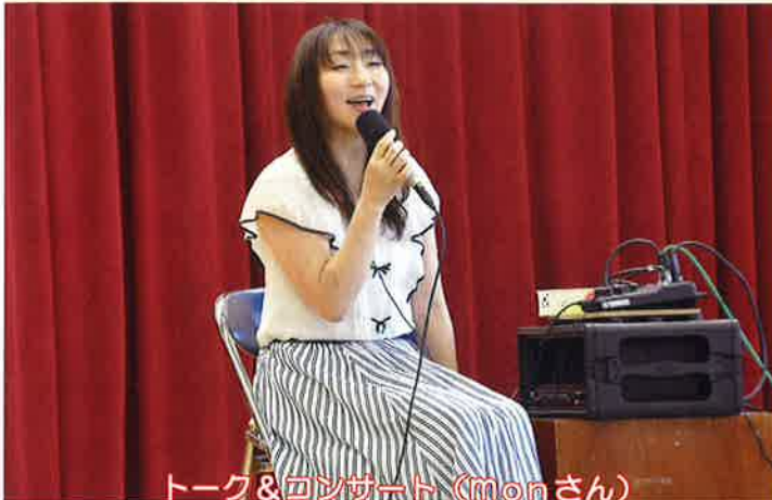
トーク&コンサート (Monさん)