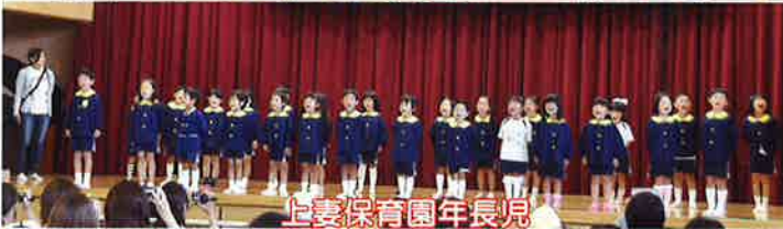
上妻保育園年長児