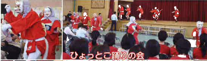
ひょっとこ踊りの会