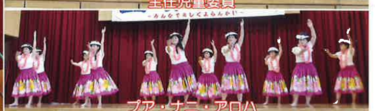
プア・ナニ・アロハ