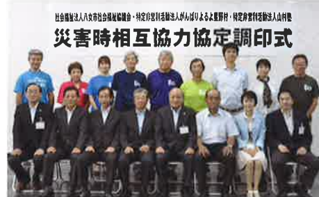
社会福祉法人八女市社会福祉協議会・特定非営利活動法人がんばりよるよ星野村・特定非営利活動法人山村塾 災害時相互協力協定調印式