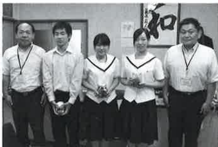
福島高校プラスバンド部定期演奏会時の募金 福島高校生徒会の皆さまによる学内募金

平成29年7月5日からの大雨災害義援金につきまして、多くの皆様よりご協力をいただいております。寄せられた義援金については、福岡県が設置する義援金配分委員会を通じて被災者に届けられます。温かいご協力に感謝申し上げますとともに、引き続きご支援をよろしくお願いいたします。