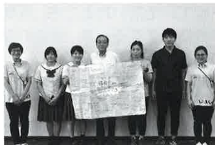
伍福会「ふるさと」夏まつり時の職員及び 参加ボランティアによるイベント募金