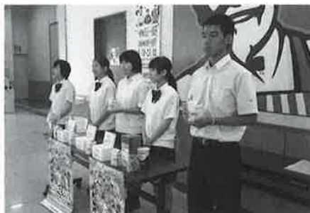
西日本短期大学附属高等学校の皆さま による街頭募金