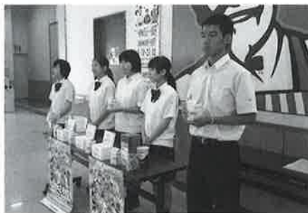
西日本短期大学附属高等学校の皆さま による街頭募金