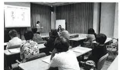
▲耳の健康についての講義