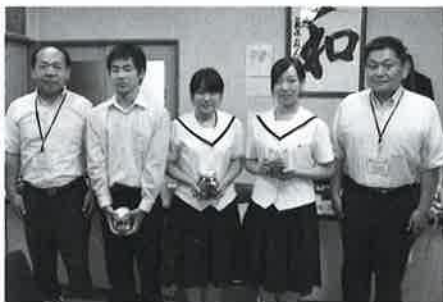
福島高校プラスバンド部定期演奏会時の募金 福島高校生徒会の皆さまによる学内募金

温かいご協力に感謝申し上げますとともに、引き続きご支援をよろしくお願いいたします。