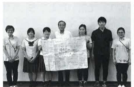
伍福会「ふるさと」夏まつり時の職員及び 参加ボランティアによるイベント募金