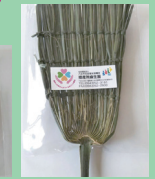
シュロのはえたたき