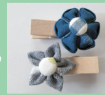
マグネットクリップ