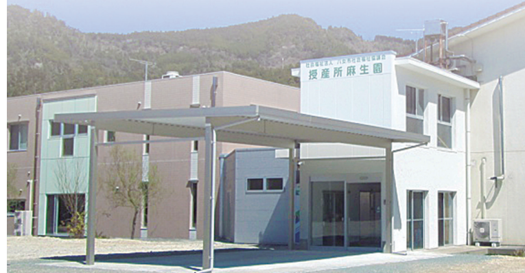
社会福祉法人 八女市社会福祉協議会